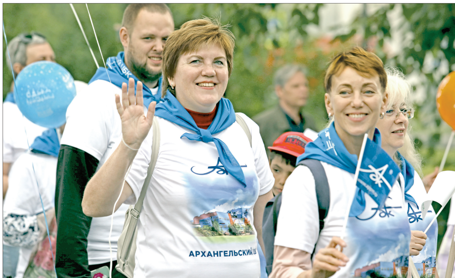
РАДОСТЬ праздника, который объединяет