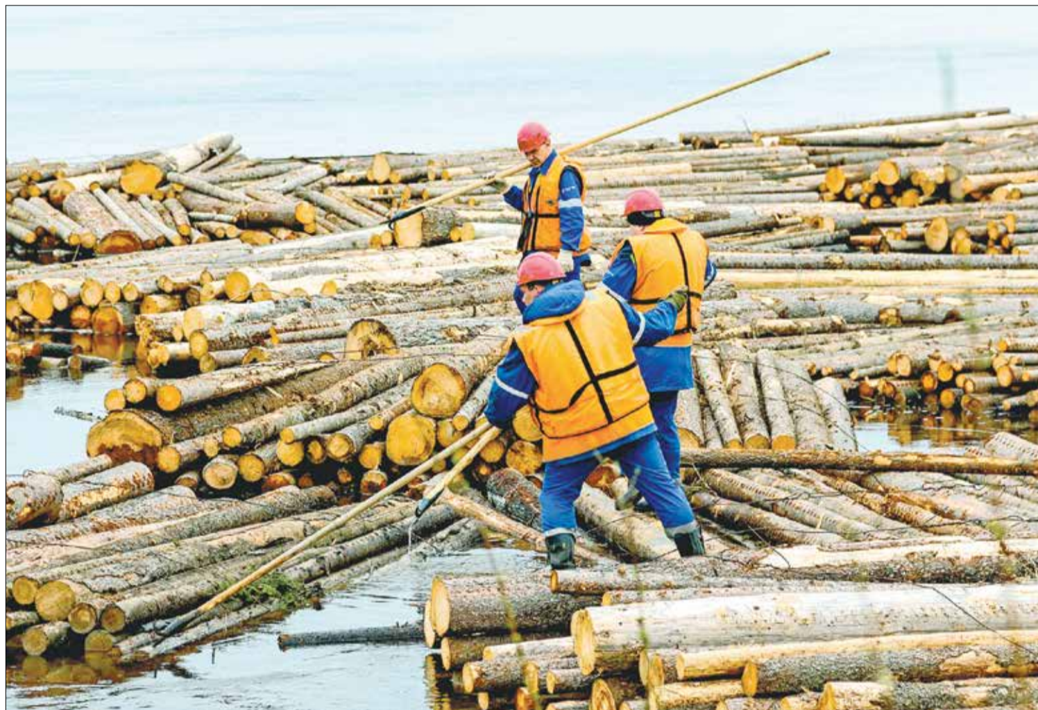
НА УЧАСТКЕ лесного рейда Архангельского ЦБК