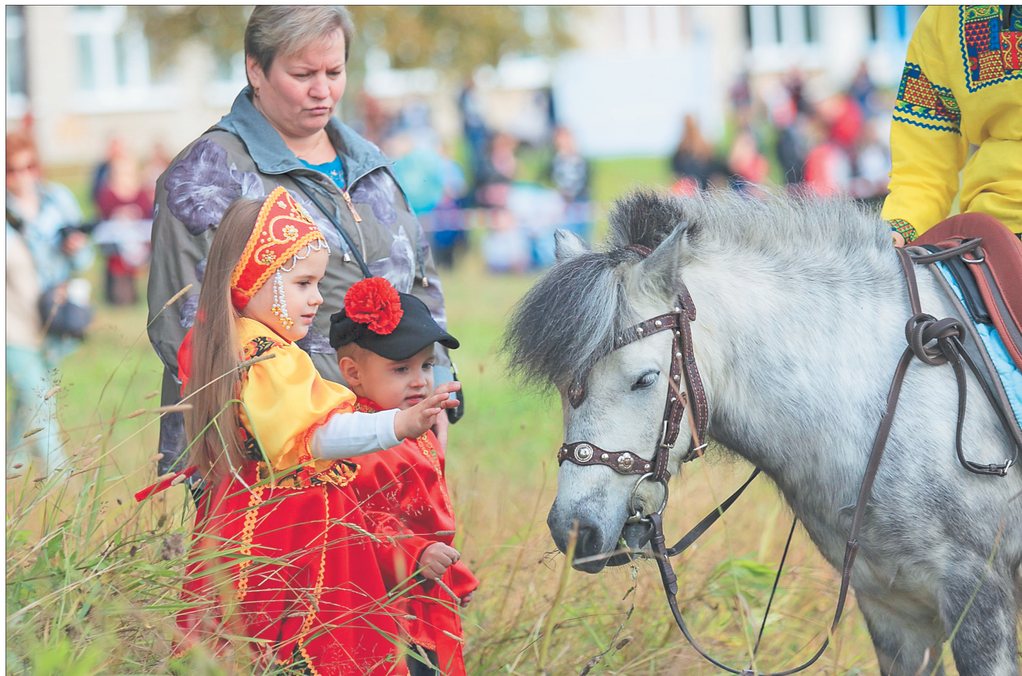
КОННЫЙ клуб «Чародей» неоднократно являлся победителем конкурса социальных инициатив Архангельского ЦБК