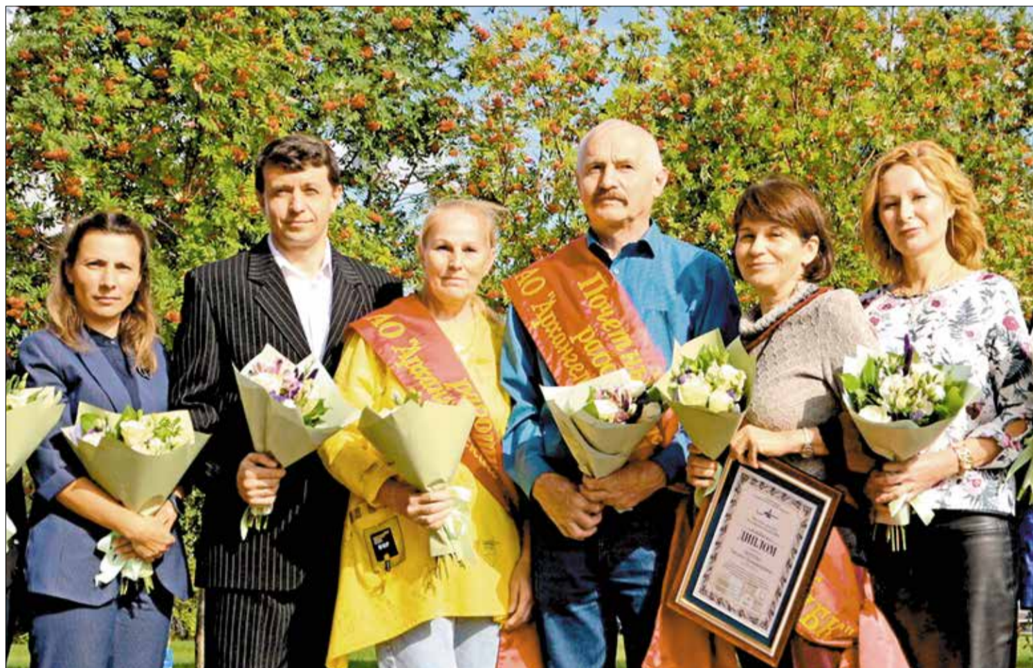
РАБОТНИКИ Архангельского ЦБК, отмеченные в дни празднования 81-летия предприятия