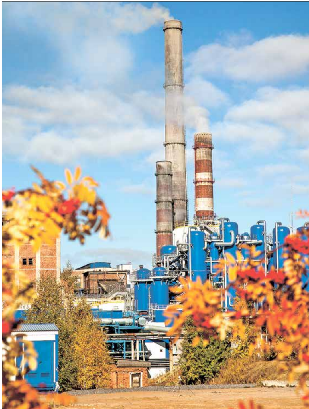
ВЕДЁТСЯ подготовка к обеспечению АЦБК газовым топливом