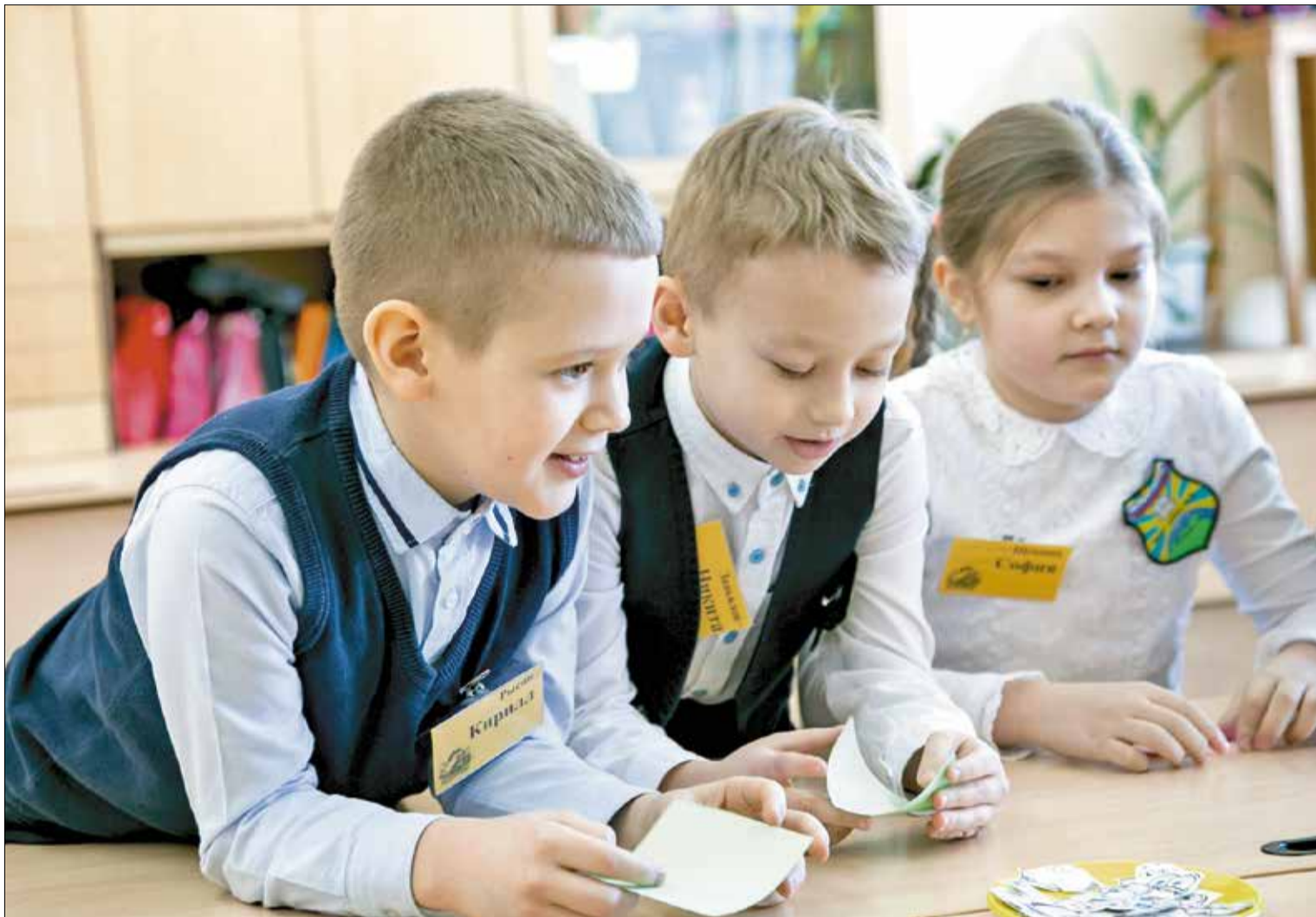
БЛАГОДАРЯ Архангельскому ЦБК ученики новодвинской школы №2 получили новые возможности для раскрытия своих талантов