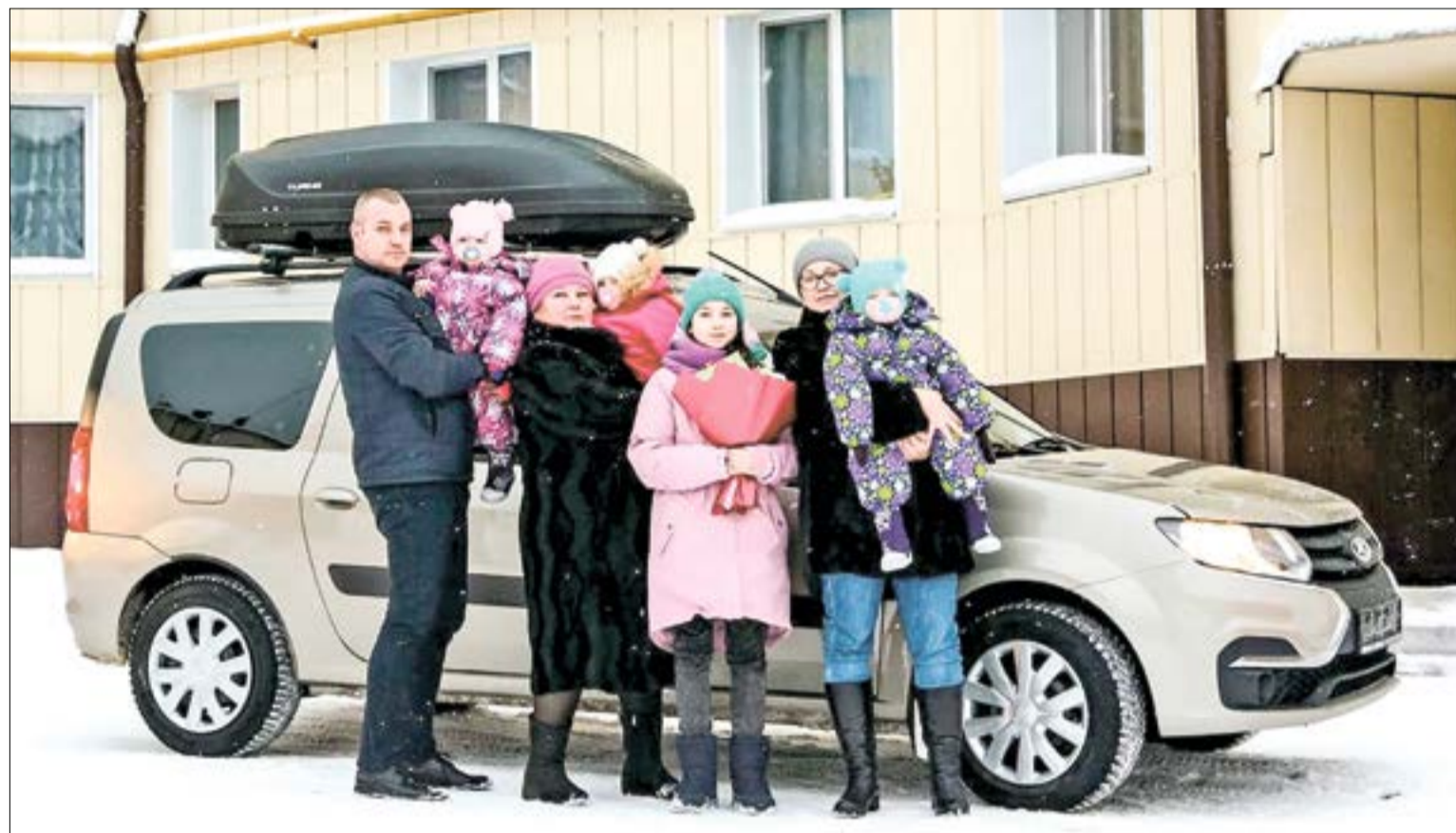
ПОДАРОК от души и на счастье