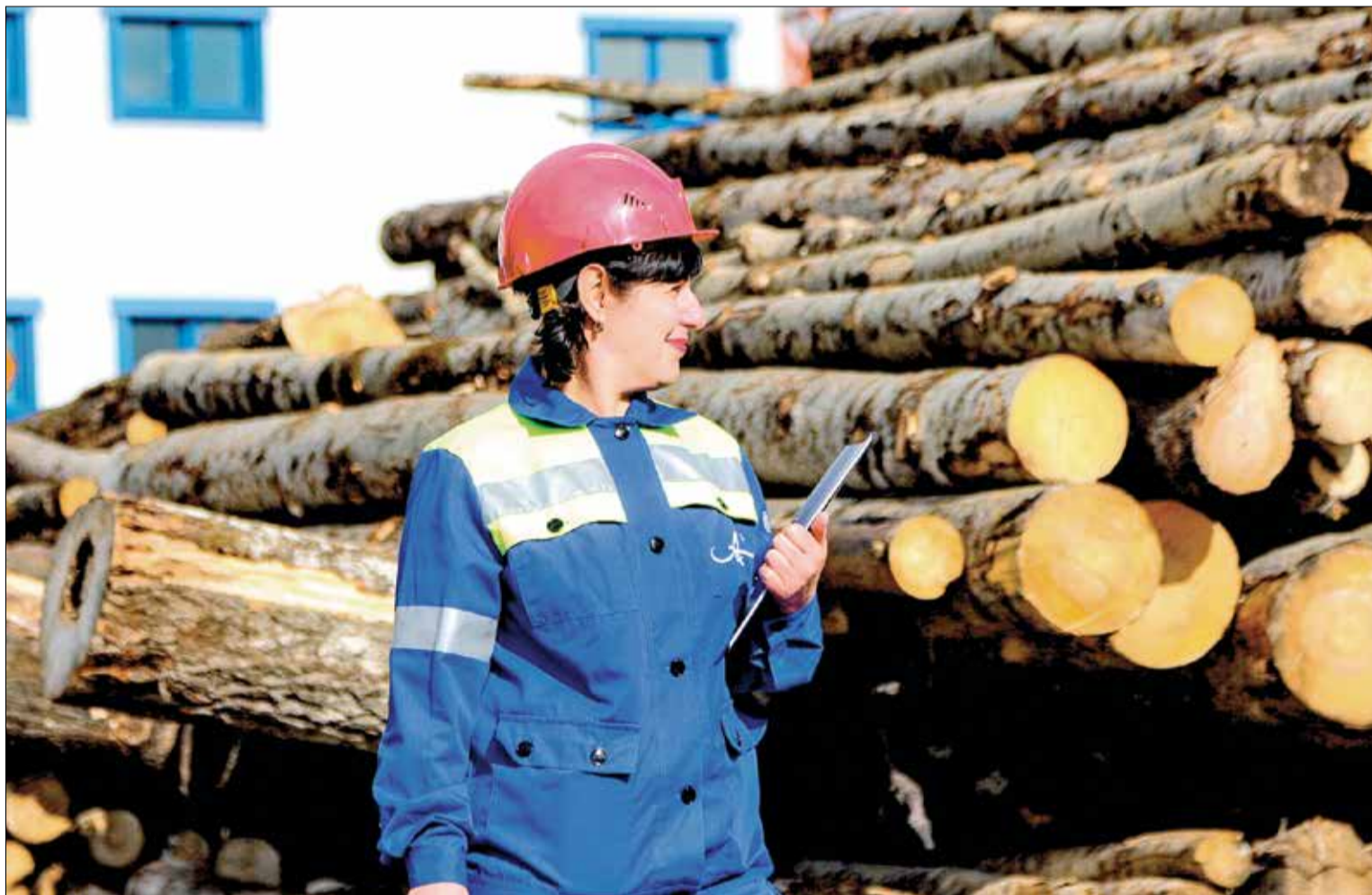
НА ДРЕВЕСНО-БИРЖЕВОМ ПРОИЗВОДСТВЕ Архангельского ЦБК