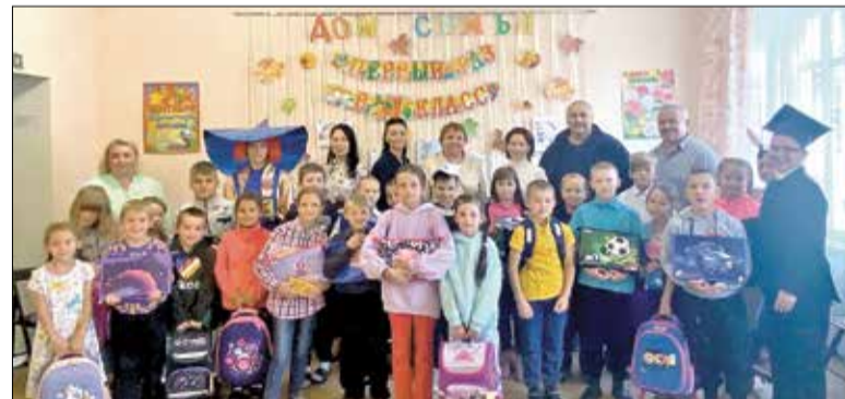
Вручение портфелей новодвинским первоклассникам в рамках акции «Поможем детям Поморья!»

Ежегодно благотворители и волонтеры посещают детские социальные учреждения области и передают первоклассникам укомплектованные ученические ранцы. В этом году автопробег побывал в Котласе и Вилегодском районе Архангельской области, а подарки получили более 155 первоклассников. В городе бумажников акция «Собери ребёнка в школу» традиционно прошла в Доме семьи Новодвинского КЦСО. Ученические ранцы были переданы детям и подросткам из новодвинских семей, находящихся под опекой Дома семьи и новодвинского отделения Красного Креста.