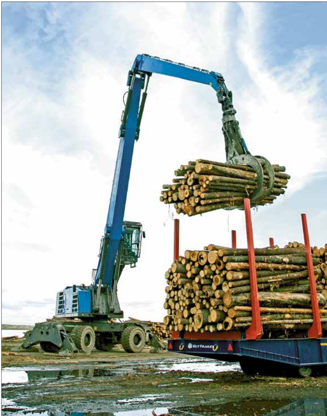
ПОГРУЗКА древесины с баржи на прицеп тягача Terberg на лесном причале АЦБК