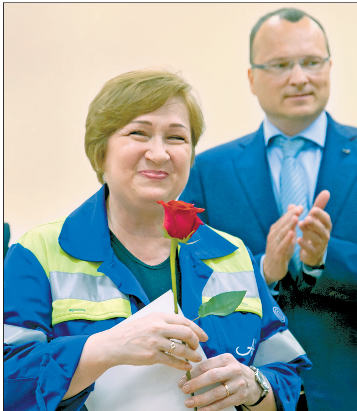
ВОСХИЩЕНИЕ и признание – всем женщинам коллектива комбината!