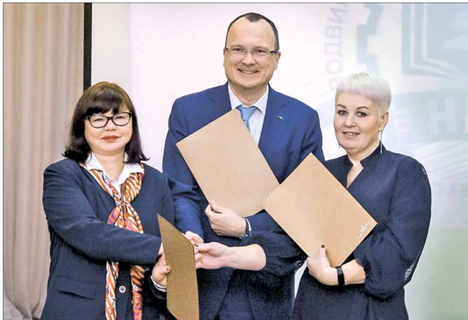
НА СНИМКЕ: Архангельский ЦБК, САФУ и НИТ – работа в содружестве