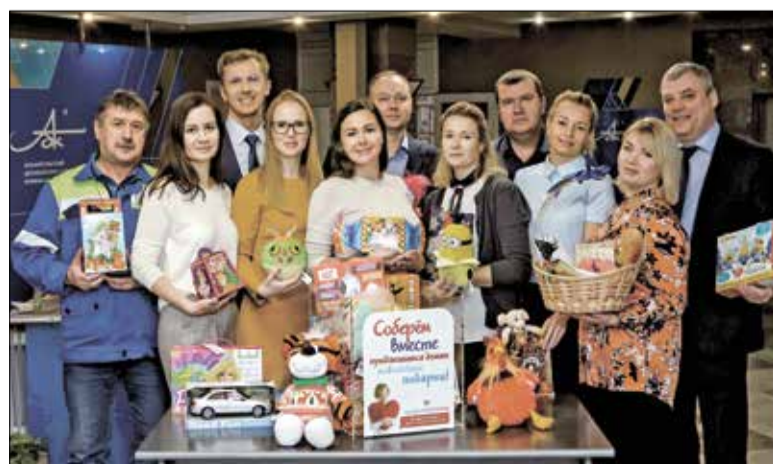
Представители коллектива автотранспортного управления Архангельского ЦБК