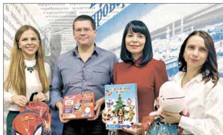
Сотрудники отдела корпоративных проектов АО «Архангельский ЦБК»

Ребята с трудным детством должны знать, что наш мир добрый и право на счастье есть у всех! А помочь в этом можем только мы – взрослые.