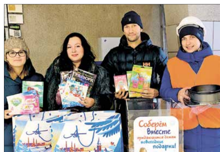
Активисты молодёжного совета АЦБК