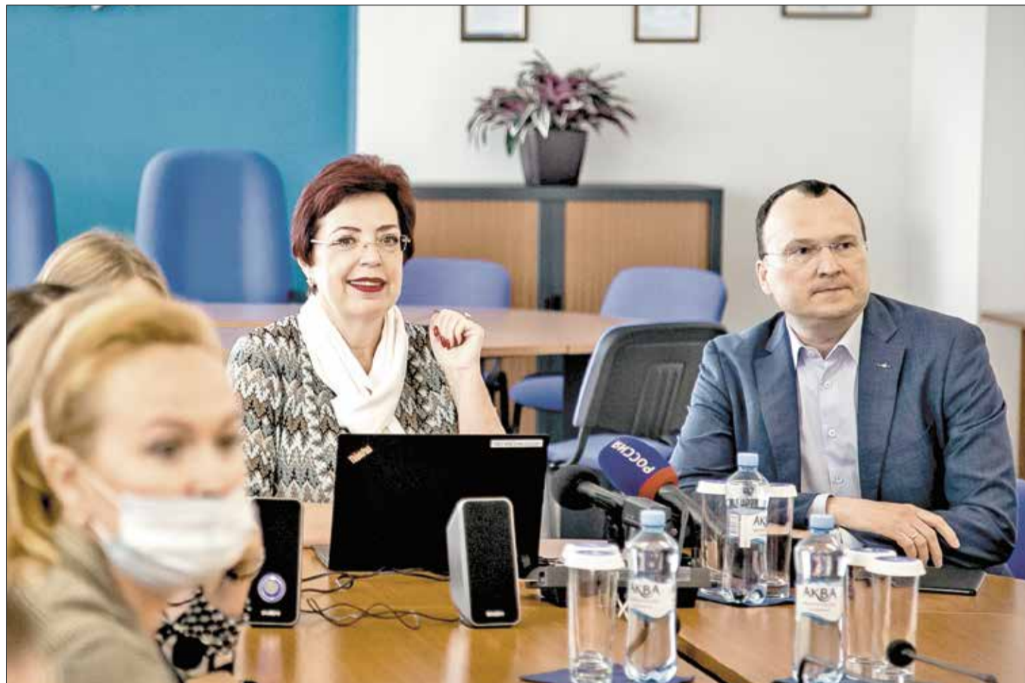
АЦБК противостоит коронавирусу