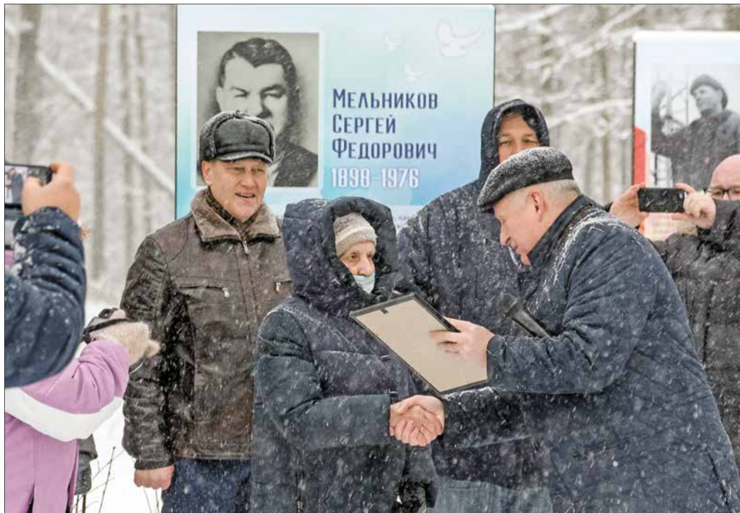
ВРУЧЕНИЕ благодарностей новодвинским инициаторам открытия Аллеи Героев