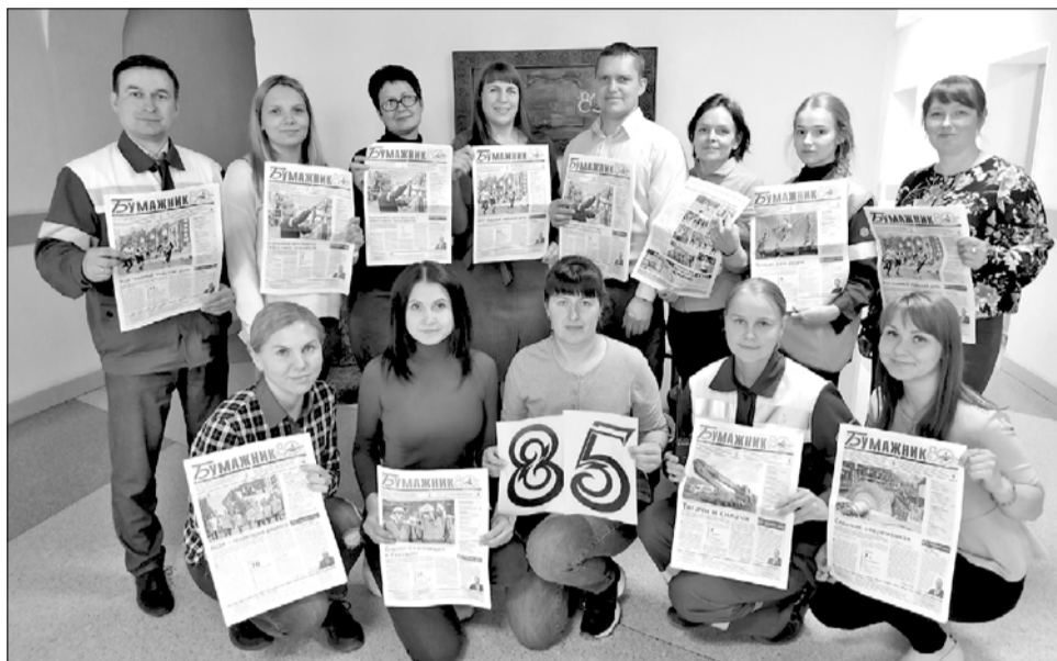
Участники конкурса «Я читаю газету «Бумажник»

Сотрудники газеты неоднократно принимали участие в создании книг, посвящённых вопросам истории комбината, региона и