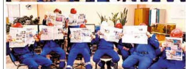
«Бумажника» хватит на всех