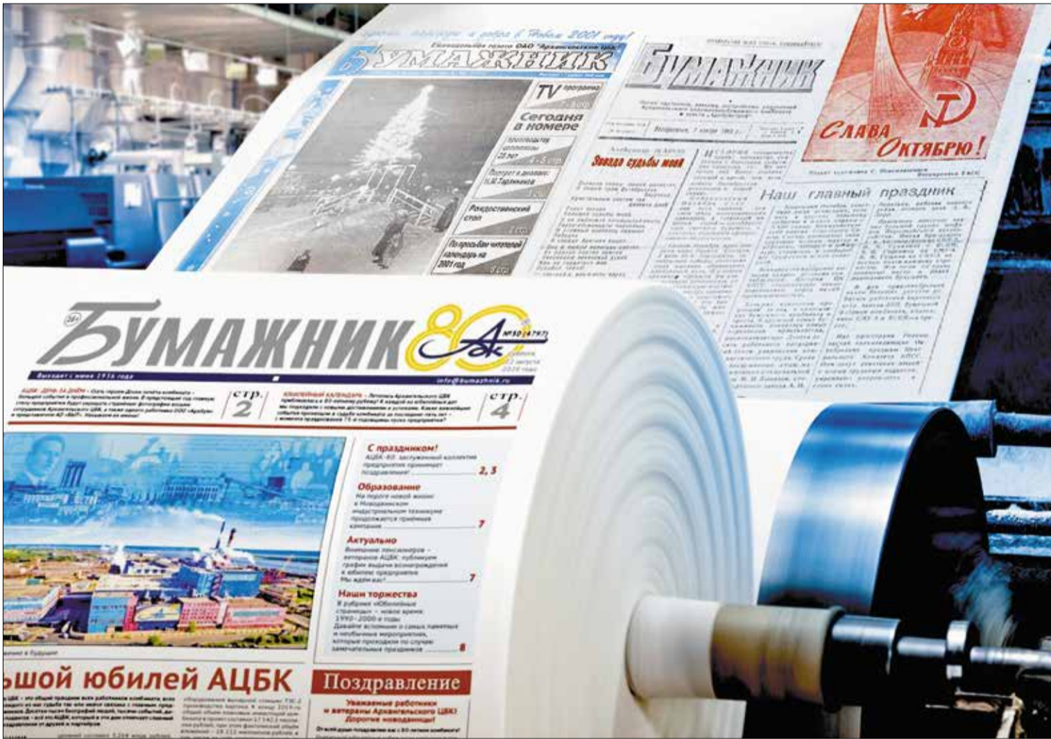
СЛОВО и дело: работаем для читателя!

Город За комфортный Новодвинск: горожане выбрали три территории для благоустройства в 2022 году. Какие? ..... 3