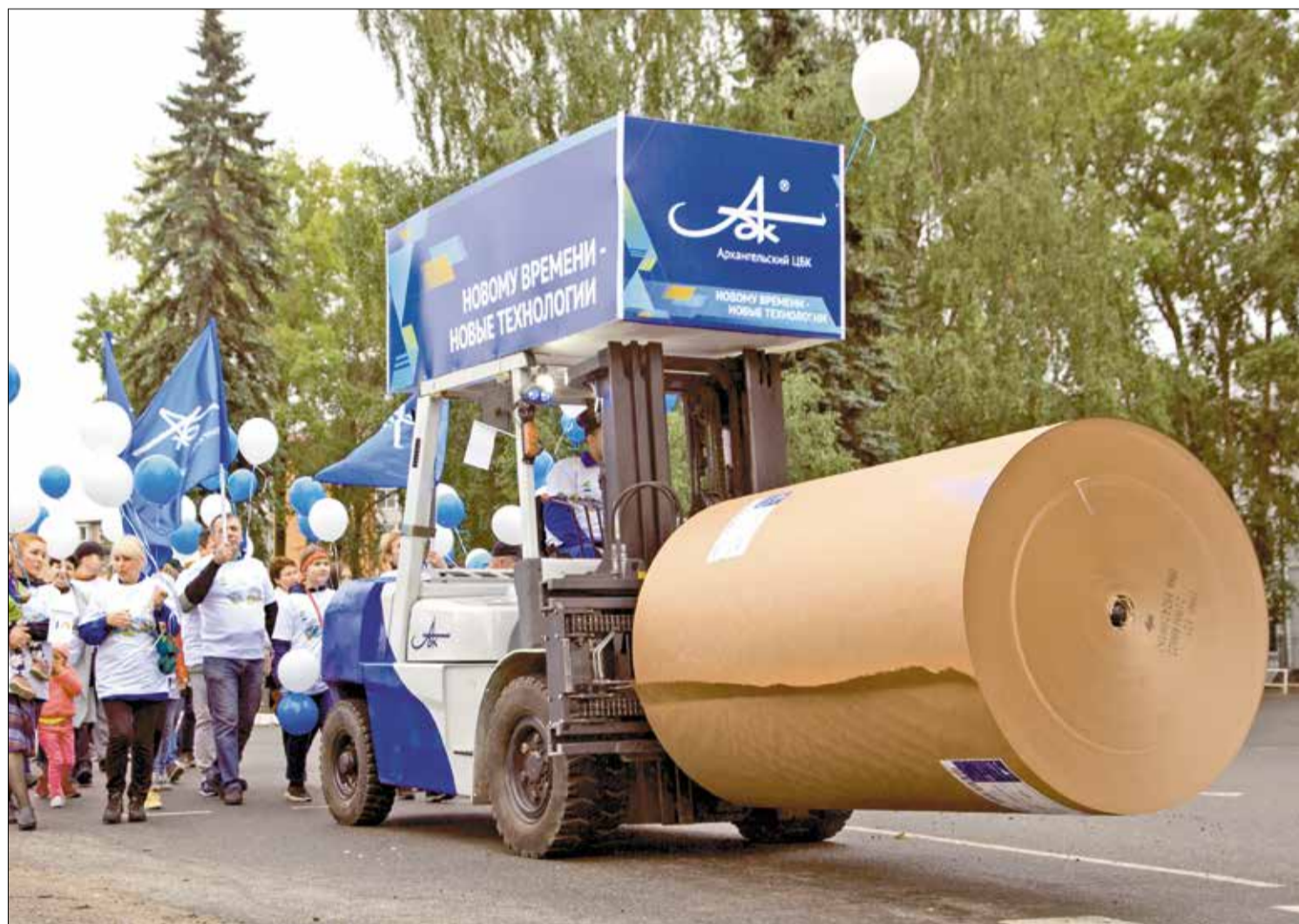
СОЛИДАРНОСТЬ и единство работников АЦБК – основа движения вперёд