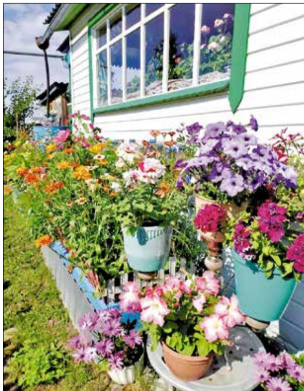
Участок Оксаны Мельниковой

Ольга ВОРОНИНА