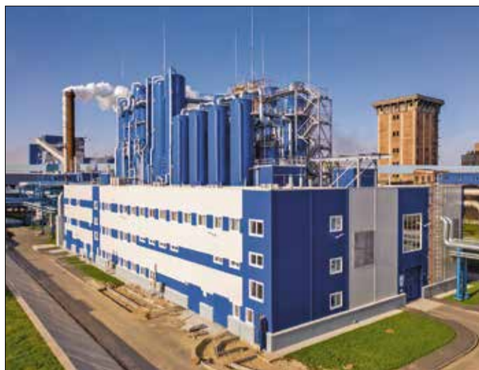
Новая выпарная станция Архангельского ЦБК

Вопросами железнодорожной логистики занимается дочерняя компания АЦБК – ООО «Архбум». Поставщиком лесосырья на комбинат традиционно является Группа компаний «Титан» – крупнейший лесоператор на Северо-Западе России.