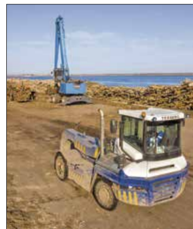
Увеличился парк лесозаготовительной, дорожной и специальной техники АЦБК