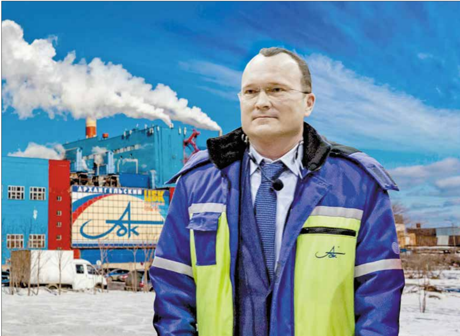
У АРХАНГЕЛЬСКОГО ЦБК ясные горизонты