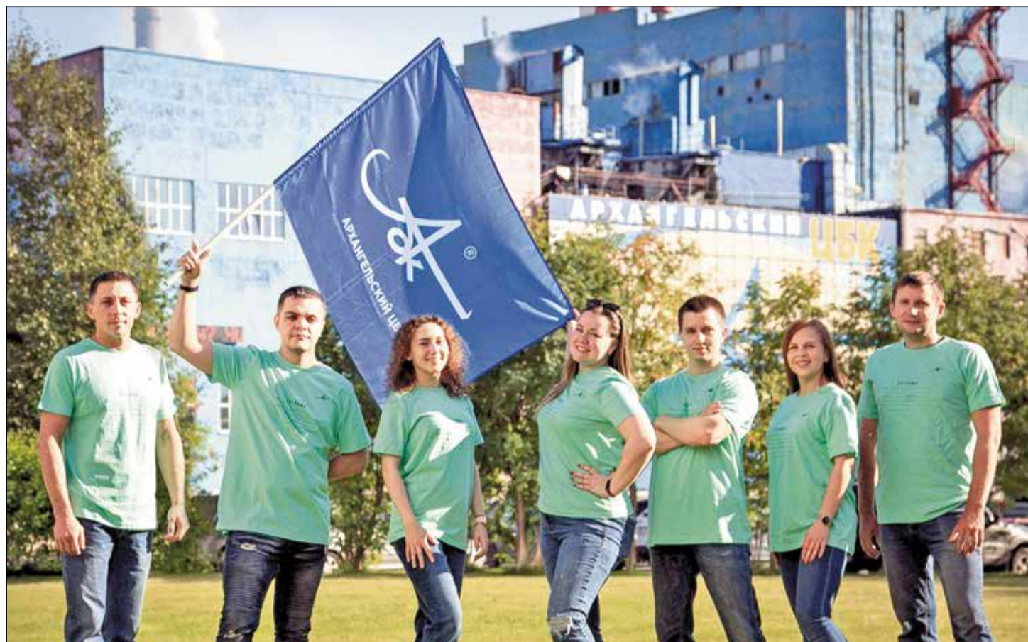
ЭНЕРГИЯ МОЛОДОСТИ: комбинат отметил юбилей