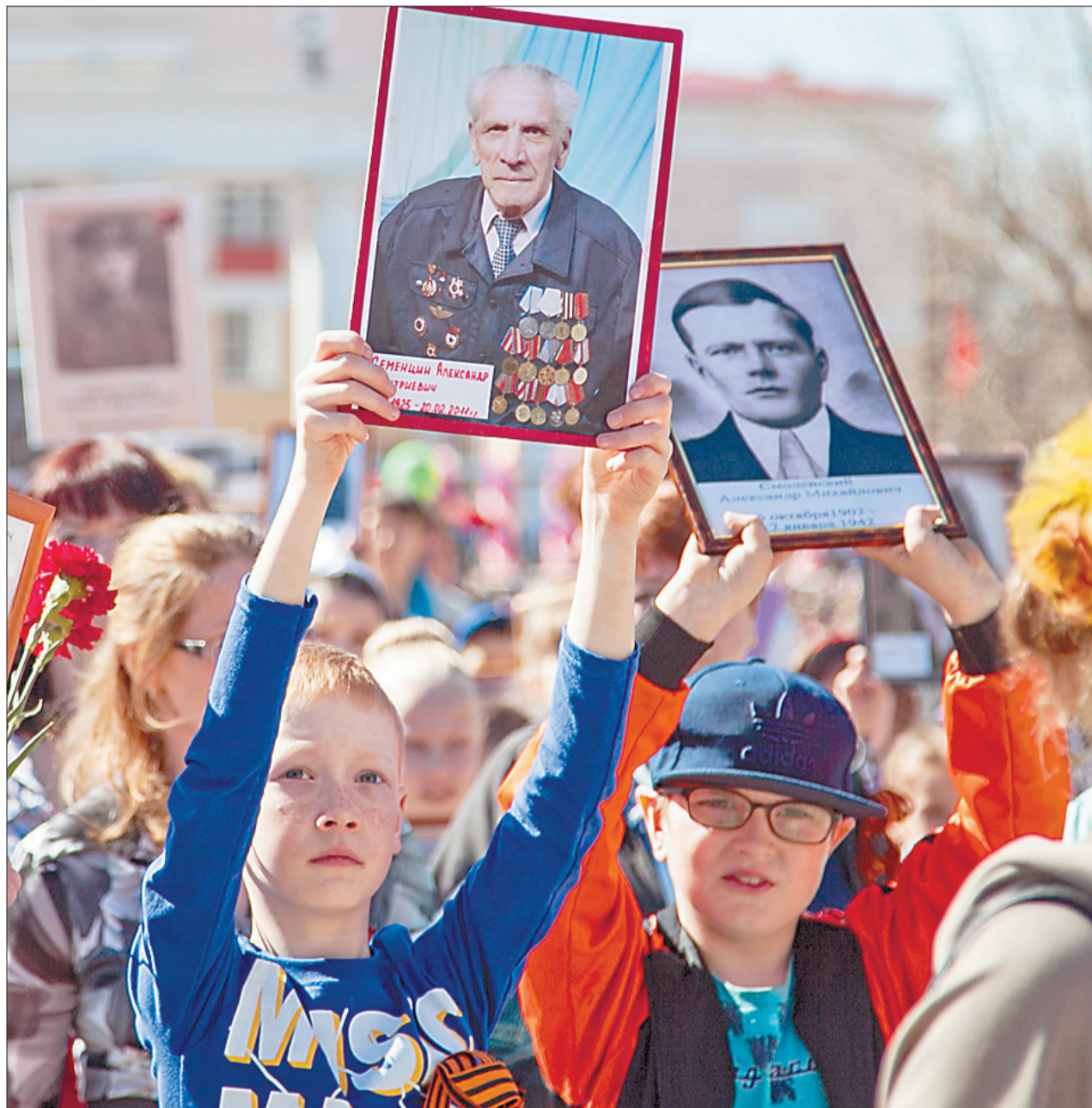
«БЕССМЕРТНЫЙ ПОЛК»: герои и их потомки – в едином строю!