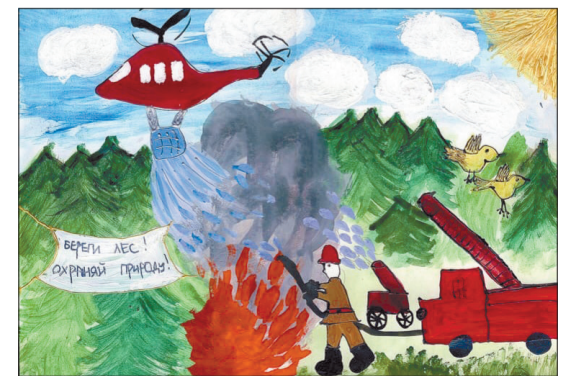
Автор: Виталина Кобелева, 8 лет. Название работы: «Береги лес! Охраняй природу!»

Все участники получат сувениры, а победители – памятные призы!