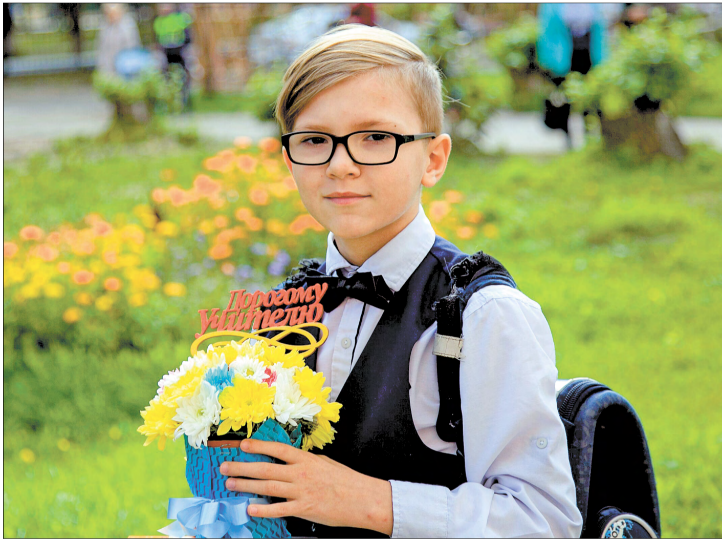
В НОВОДВИНСКЕ стартовал новый учебный год