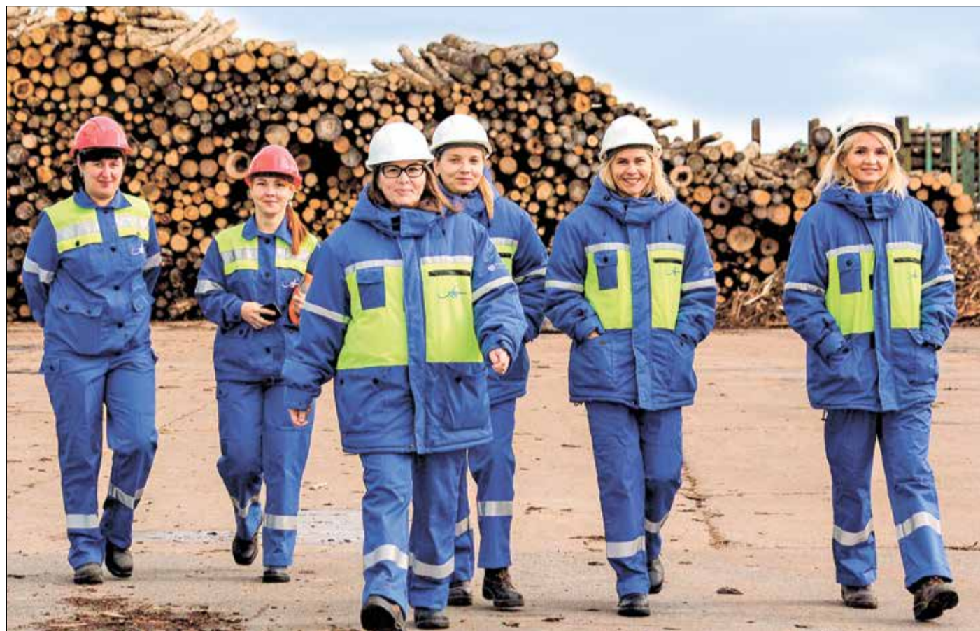
НОВАЯ эпоха древесно-бумажного производства АЦБК