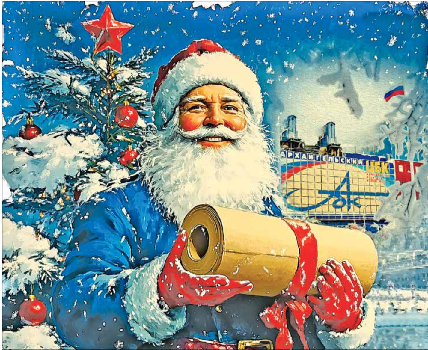
ПУСТЬ в наступающем году будут только добрые события!