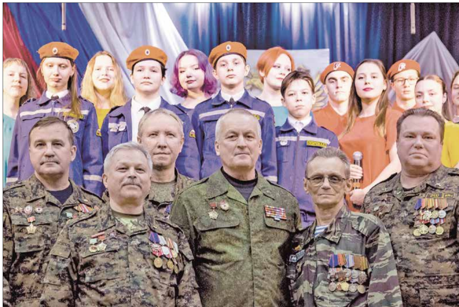
ГЕРОИ среди нас