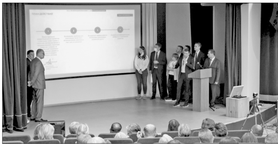
В научной библиотеке САФУ на стратегической сессии был представлен проект «Прорыв-2027»

На следующий день производственные масштабы предприятия смогли оценить делегации представителей АО «КРДВ», министерства экономического развития, промышленности и науки Архангельской области, Агентства регионального развития.