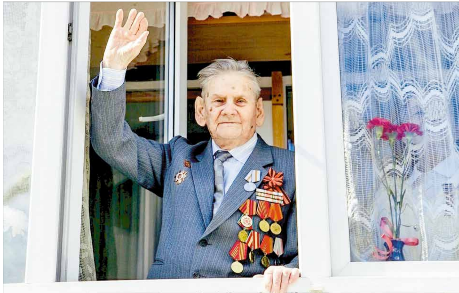
ПАМЯТЬ о войне храним свято! Фото сделано 9 мая 2020 года