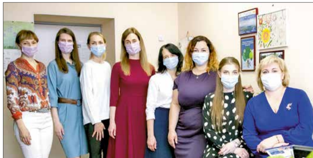
Сотрудники отдела экологии комбината

II Согласно рейтингу RAEX АО «Архангельский ЦБК» входит в топ-3 российских компаний по затратам на защиту природы.