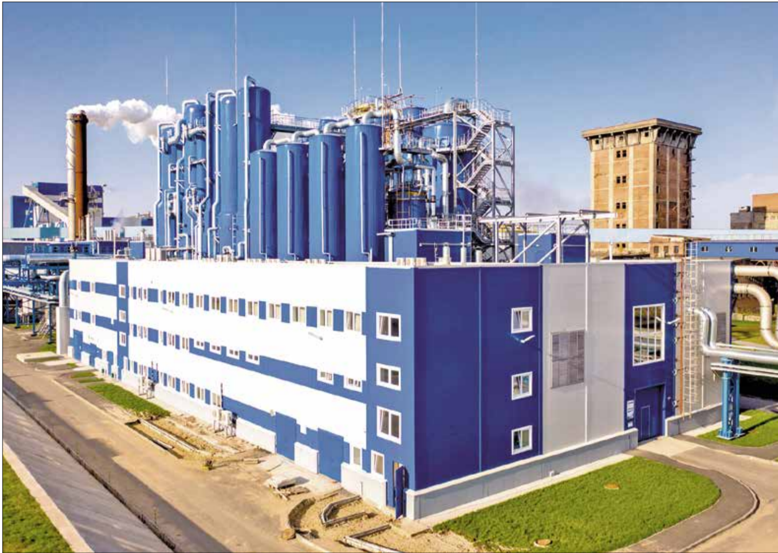
НОВАЯ выпарная станция АЦБК: высокая функциональность производства и изящество архитектурных форм