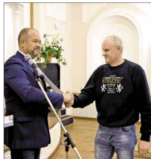
Награждение профсоюзных активистов ко Дню работников леса

портом работникам и их детям – один раз в два года;