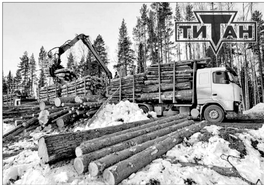
Код лицензии АО «Архангельский ЦБК» – FSC-C002853

Сейчас годовой объём поставок лесного сырья в адрес АО «Архангельский ЦБК» и ЗАО «Лесозавод 25» – более 5,5 млн м 3 , из которых свыше 4 млн