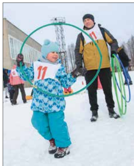
Победители состязаний «Семейные старты» награждаются призами от профкома АЦБК