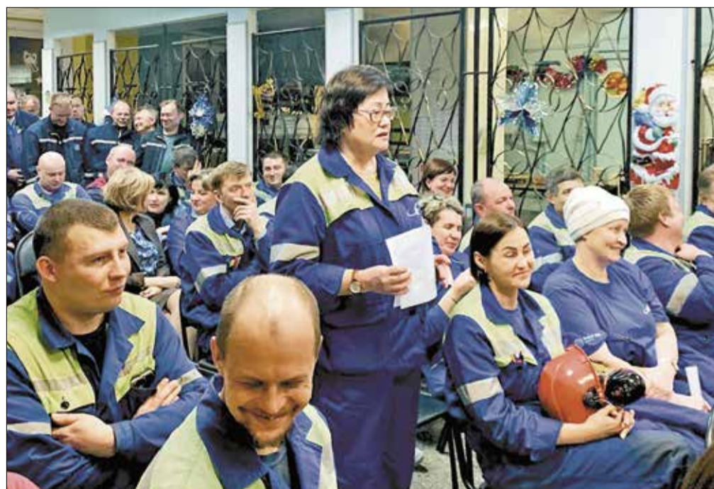
Традиционные встречи руководства и профсоюзного комитета АО «Архангельский ЦБК» с коллективом предприятия