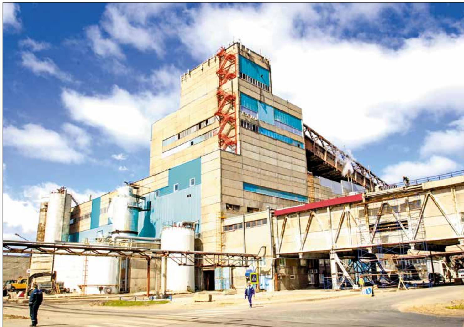
ПРОИЗВОДСТВО целлюлозы АО «Архангельский ЦБК»