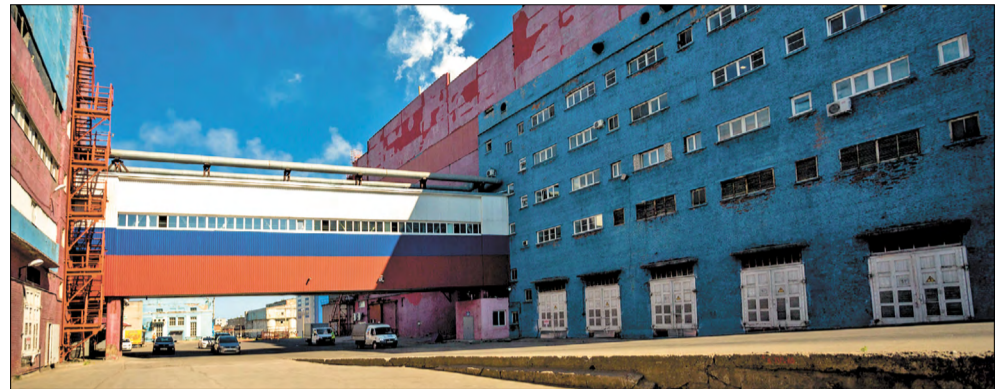
Статистика нарушений пропускного режима на Архангельском ЦБК

– Согласно Трудовому кодексу РФ неоднократные нарушения трудовых обязанностей, в том числе опоздания, преждевременные уходы, продолжительное отсутствие на рабочем месте, влекут за собой применение к сотруднику дисциплинарных взысканий: замечание, выговор, увольнение по соответствующим основаниям.