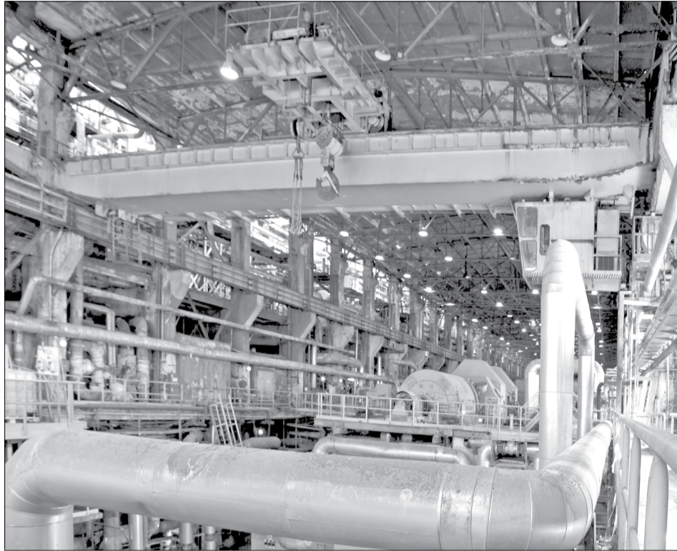
Оборудование турбинного цеха ТЭС-1 обновляется

Несмотря на то что будущий турбоагрегат №7 обладает такой же мощностью, как и прежний (60 МВт), он относится к технике нового поколения. В частности, турбина будет оборудована электронно-гидравлической системой автоматического регулирования (как и установленная в 2013 году турбина №5). Функционирование современной системы диагностики «ПРАНА», разработанной специалистами АО «РОТЕК», позволит контролировать техническое состояние паровой турбины во время работы.