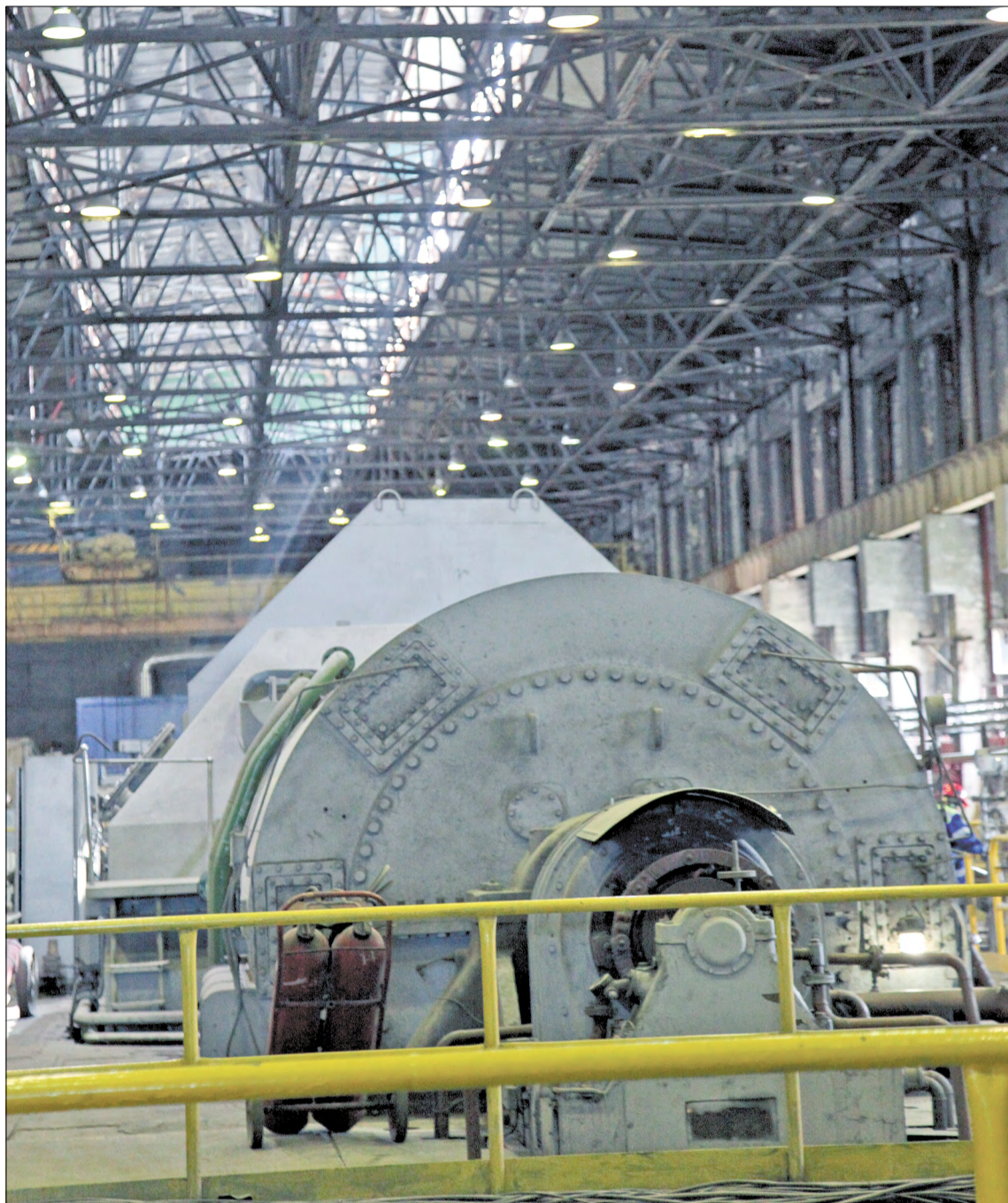
В ТУРБИННОМ цехе первой теплоэлектростанции АЦБК