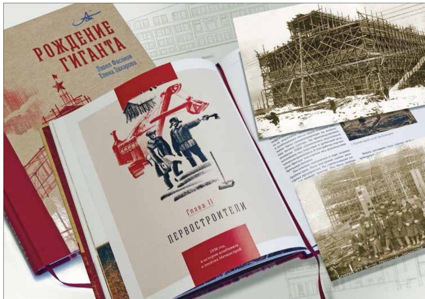
В КНИГЕ Архангельского ЦБК – наша с вами история