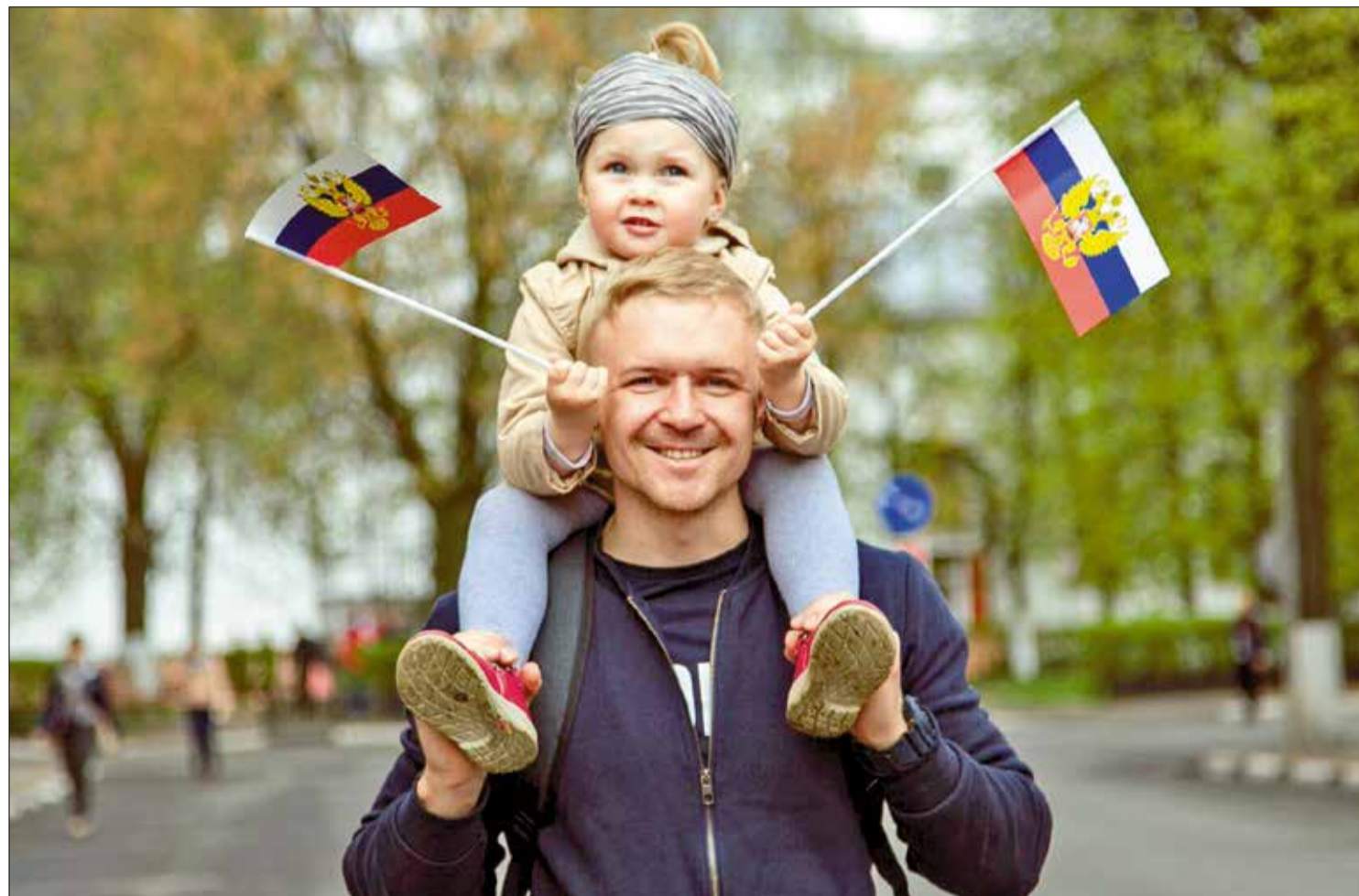
НАШ выбор – наш успех