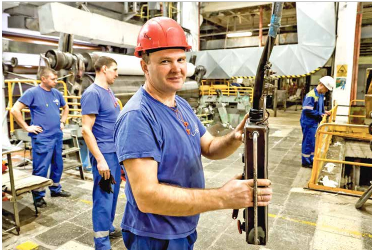
РАБОЧИЕ БУДНИ на бумфабрике Архангельского ЦБК