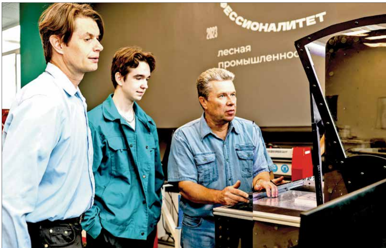
ПРЕПОДАВАТЕЛИ И СТУДЕНТЫ Новодвинского индустриального техникума знакомятся с функционалом нового учебного фрезерного станка