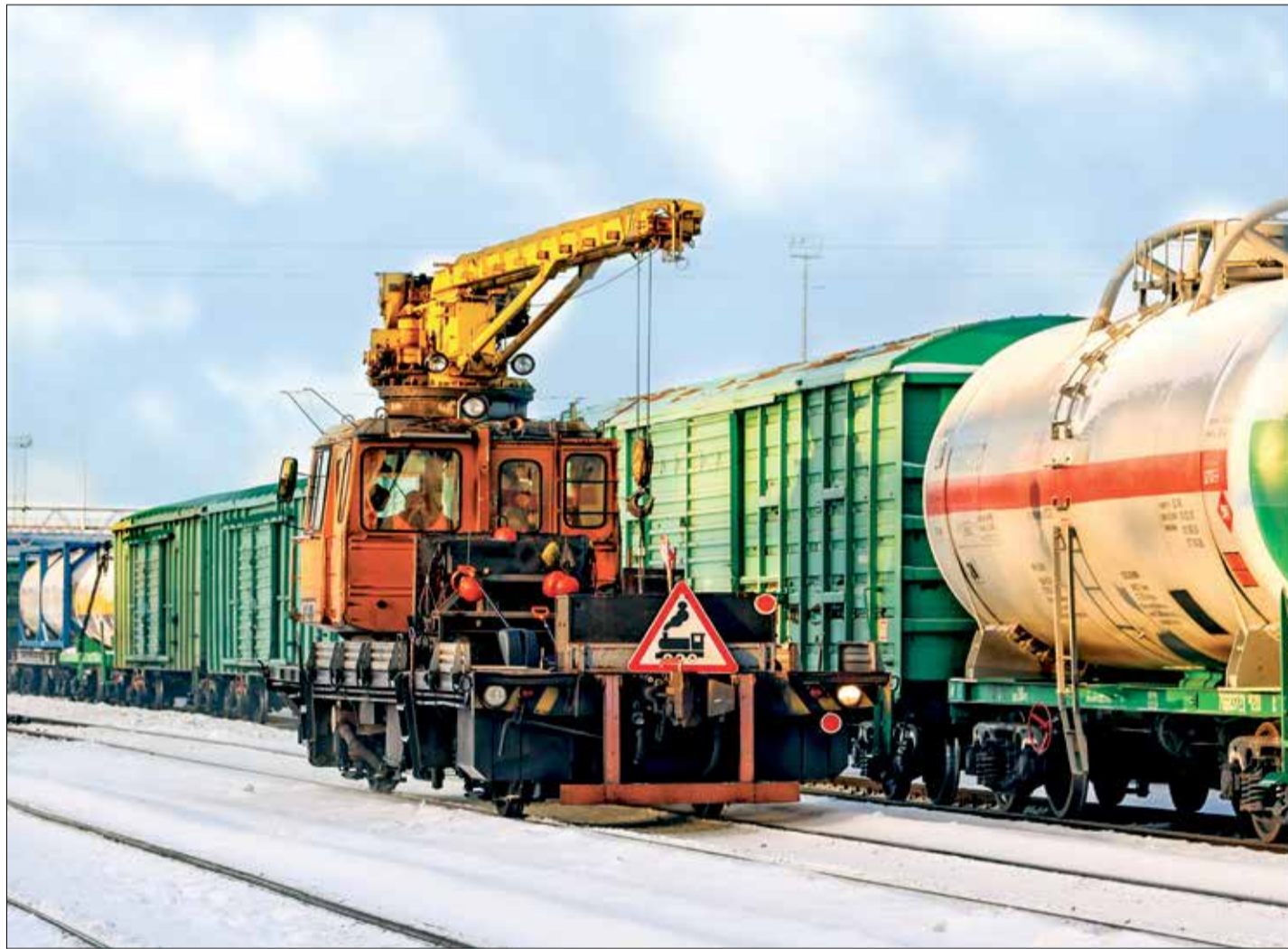
НА ЖЕЛЕЗНОДОРОЖНЫХ ПУТЯХ у производства целлюлозы Архангельского ЦБК