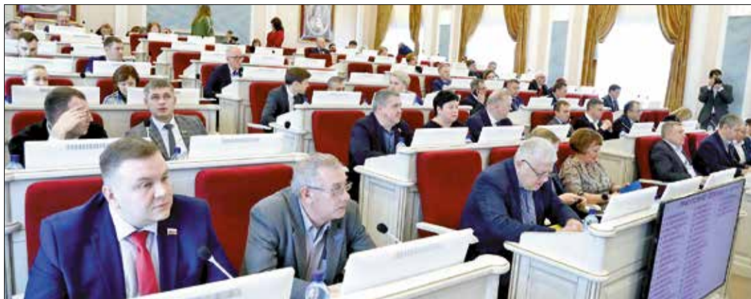
На сессии Архангельского областного Собрания депутатов

Вскоре россиянам предстоит высказать своё отношение к предлагаемым поправкам в Конституцию РФ. Изменения затрагивают главы о президенте, Федеральном собрании, правительстве, судебной власти и прокуратуре, местном самоуправлении.