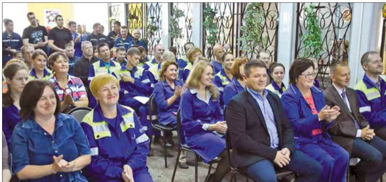
На встречах руководства АЦБК с представителями трудовых коллективов неоднократно обсуждались вопросы специальной оценки условий труда

минимальные размеры, порядок и условия предоставления гарантий и компенсаций работникам «за вредность». – В связи с законодательными требованиями в коллективном договоре Архангельского ЦБК прописаны дифференцированные размеры компенсаций и льгот, устанавливаемые в зависимости от класса условий труда на рабочих местах по результатам СОУТ, – отметила начальник отдела организации труда и заработной платы