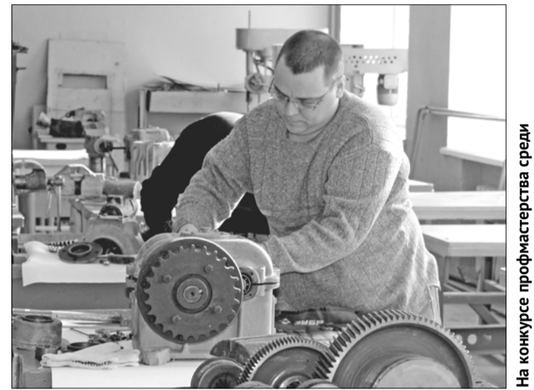
На конкурсе профмастерства среди слесарей-ремонтников

бы главного механика, службы главного метролога и другие высококвалифицированные специалисты.