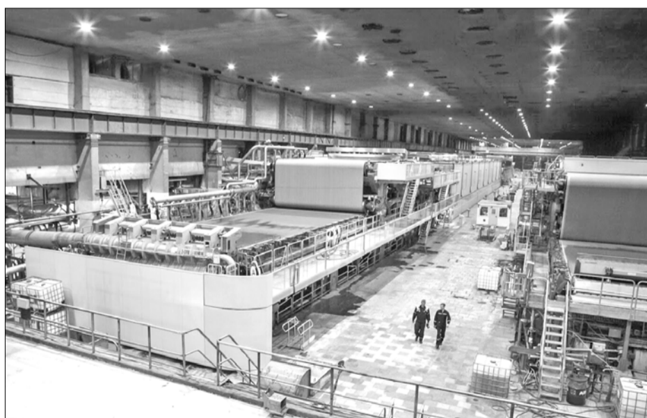
КДМ-2 Архангельского ЦБК после реконструкции

Один из них эффективно осуществлён Архангельским ЦБК. В рамках этого проекта наша компания получила две важных меры поддержки. Первая – Архангельскому ЦБК предоставлены лесные участки для заготовки древесного баланса и обеспечения прироста по выработке готовой продукции. На полученный лесной фонд до достижения по-