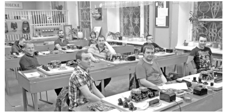
На состязании профессионалов

Для оценки мастерства участников создаётся жюри, в составе которого – опытные представители службы главного технолога, служ-