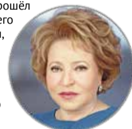
Валентина МАТВИЕНКО, председатель Совета Федерации Федерального собрания РФ

Желаю сотрудникам коллектива компании успехов, процветания, крепкого здоровья и благополучия!