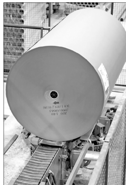
Продукция Архангельского ЦБК

Архангельский ЦБК – мощная компания на мировом рынке целлюлозно-бумажной продукции, его бренд знают далеко за пределами нашей Родины. Ежегодно тысячи тонн готовой продукции комбината отправляются за рубеж, минуя