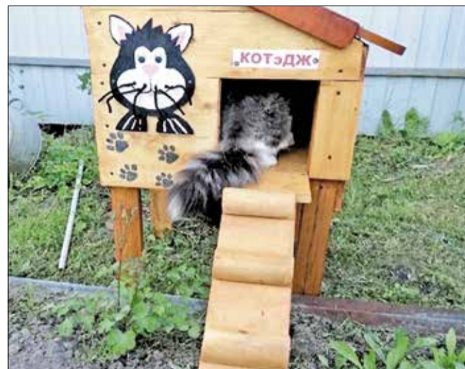
Домик для котиков «КОТэдж» от семьи Пономарёвых