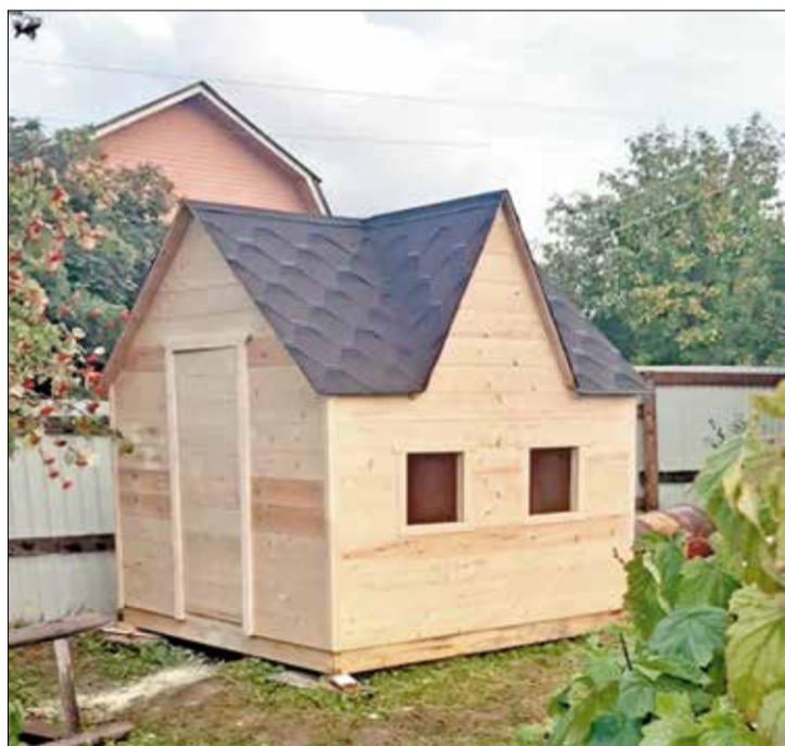
Строительные объекты Романа Тимакова