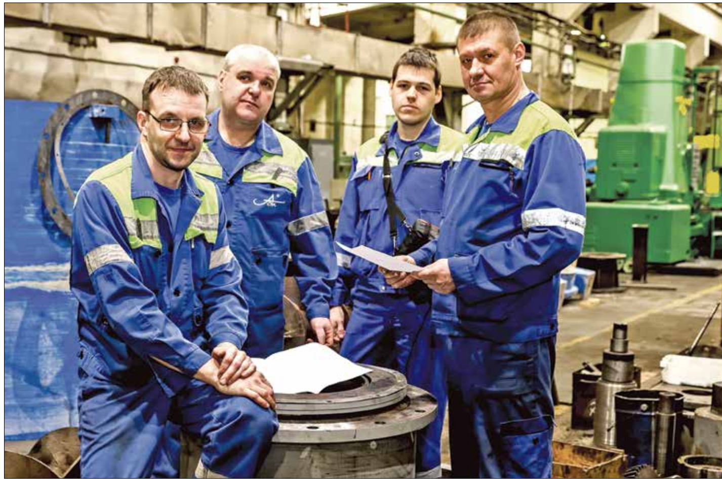
ЗНАТОКИ механики Архангельского ЦБК – в деле