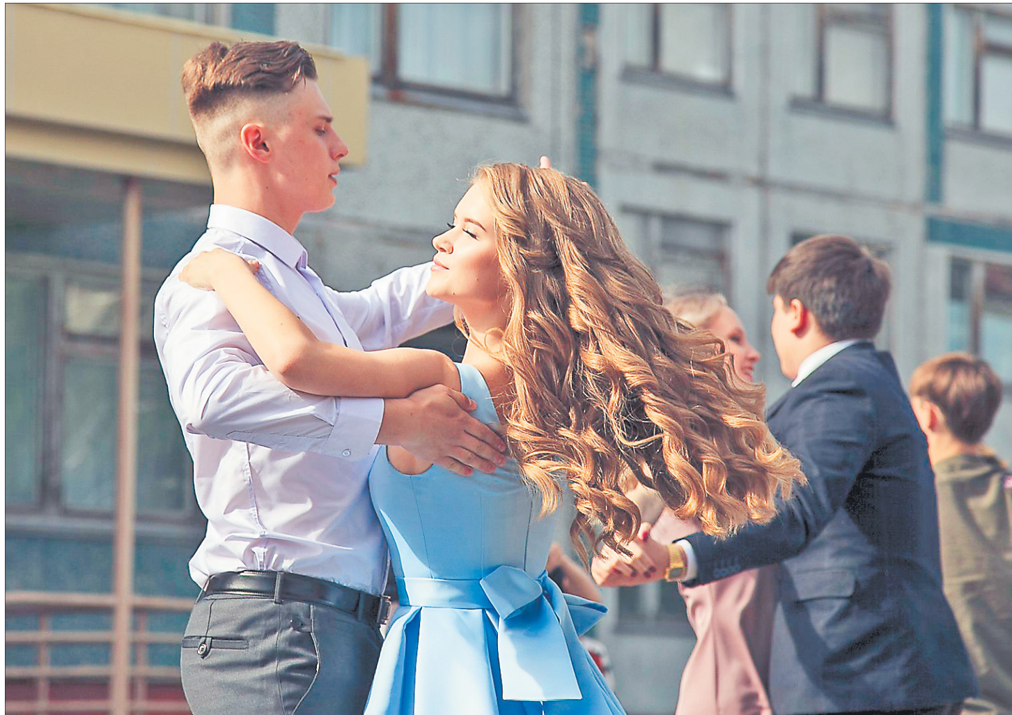
БАЛ новодвинских выпускников – память на всю жизнь