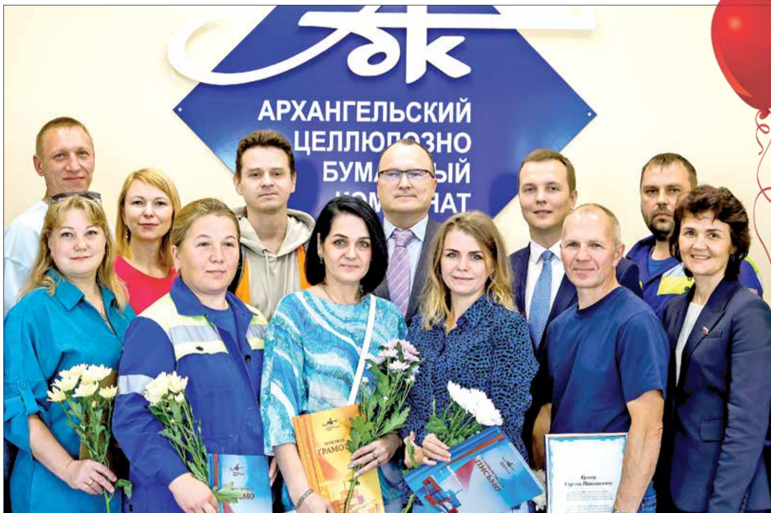
ФОТО на память после церемонии награждения на производстве целлюлозы Архангельского ЦБК