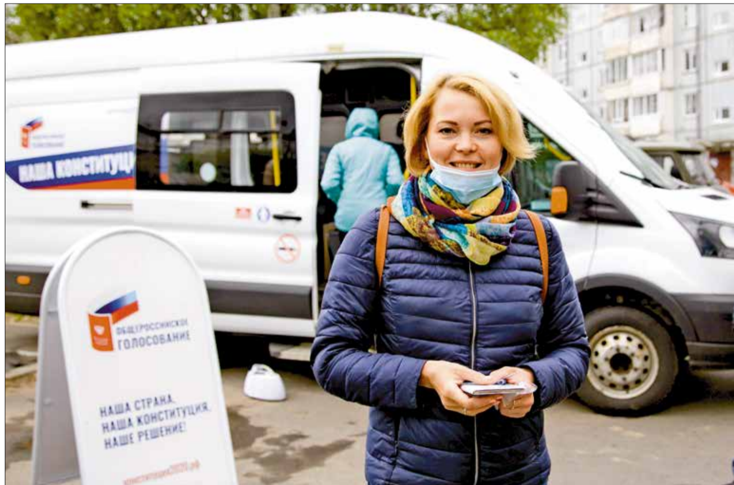
ГОЛОСОВАНИЕ на придомовой территории в Новодвинске