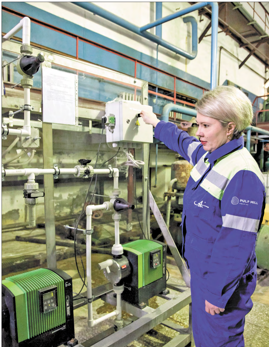
НОВОЕ оборудование цеха водоподготовки ТЭС-1