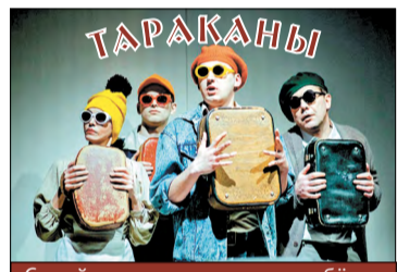
Семейная драма глазами ребёнка